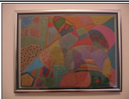
FIGURA 3 – TRABALHO PLÁSTICO CRIADO PELAS CPs SOBRE O PPP